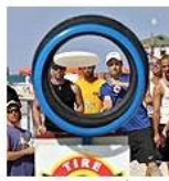
בדרך לשיא הפריסבי בהרצליה